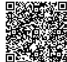
第20回福岡漢方講座

ご記入いただいた情報につきましては、個人情報保護法その他の関係法令を遵守し、安全・適切に管理します。